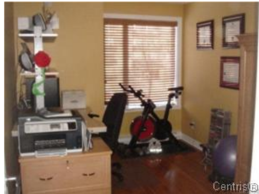
Bureau à domicile